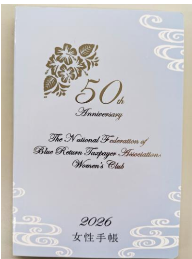
2026年度版の女性手帳です。