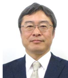
品川都税事務所長