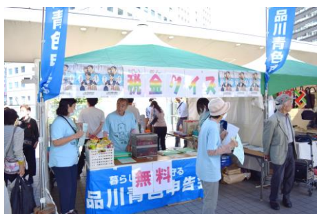
「しながわ夢さん橋」