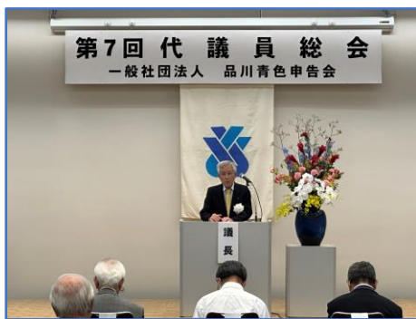
令和5年「第7回 代議員総会」