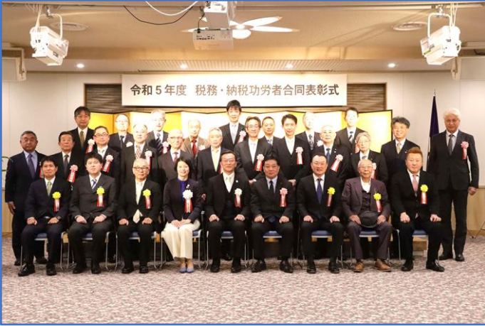
令和6年1月26日納税功労表彰式