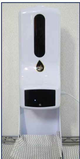
事務局入口に検温器があります