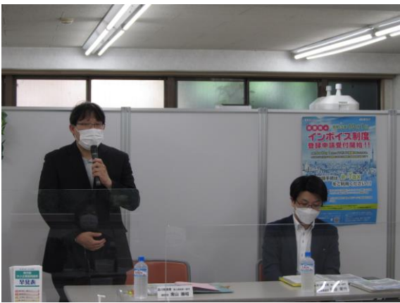
講師※品川税務署 南山統括官・所谷推進官

令和4年6月24日(水)・7月19日(火)に、インボイス制度の研修会を行いました。 消費税の基礎的な内容から、インボイス制度の概要や申請手続き等について詳しく説明していただき、多くの方が熱心に受講しました。