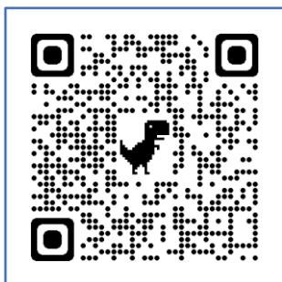
自宅療養証明書 発行申請書

140-8715 品川区広町 2-1-36 品川区保健所保健予防課 感染症対策係 療養証明書担当 宛