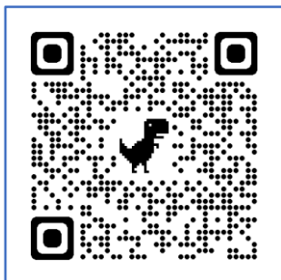
自宅療養証明書 交付申請サイト

※品川区では、証明書が必要な方の請求手続きがインターネット又は郵送でおこなうことができます。 郵送の場合は下記の住所に必要な書類を送ってください。 詳細は区役所ホームページにて確認下さい。