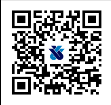
ホームページ QRコード